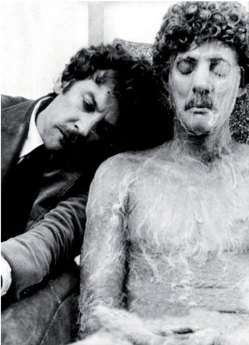
La invasión de los ultracuerpos (1978)

En tratados de psiquiatría podemos leer definiciones como "el paciente cree que una persona estrechamente relacionada con él ha sido sustituida por un doble" o "la idea delirante de que otras personas, normalmente muy cercanas al paciente, han sido reemplazadas por dobles exactos, que son impostores" . Es decir, que el paciente afectado por esta enfermedad puede ver a una persona, le reconoce en las fotos, pero la asociación que tiene entre esa persona y su "memoria afectiva" falla. Es capaz de ver a alguien que "se parece" a su amigo o familiar, pero de alguna forma está seguro de que realmente no lo es, que es un doble o un impostor.